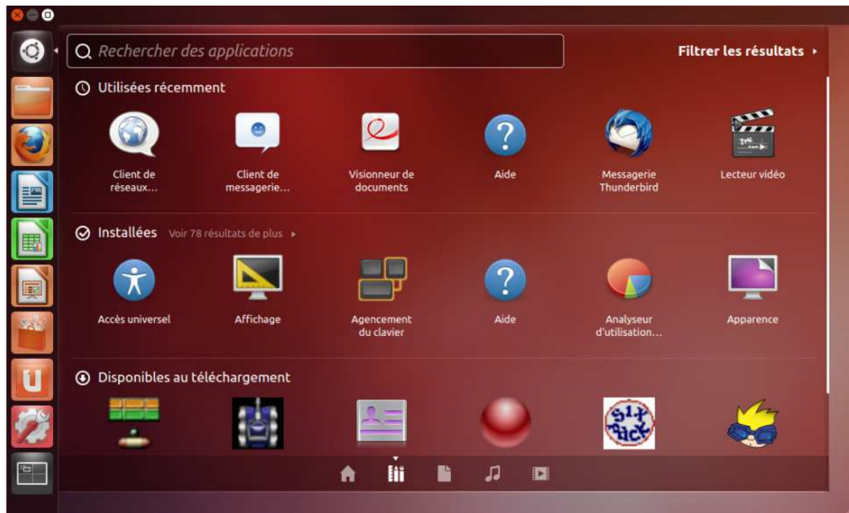
Figure 6 - Tableau de bord en mode Applications

L'utilisation des autres présentations du tableau de bord avec les lentilles Documents, musique ou vidéos est intuitive. Il suffit d'essayer.