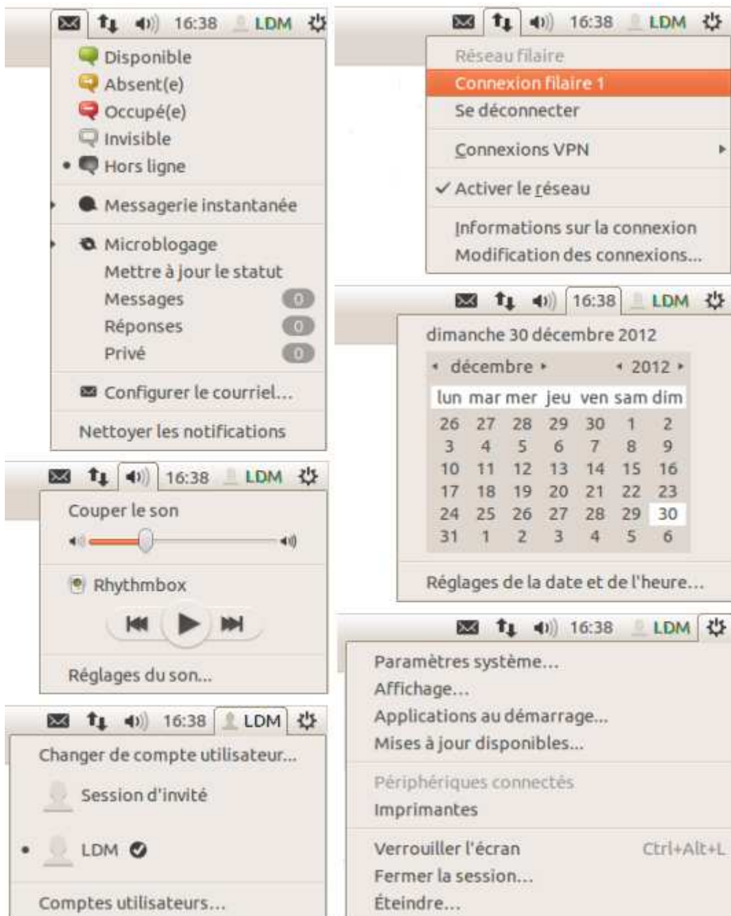
Figure 4 - Les indicateurs et sous-menus associés

Tous les indicateurs sont des boutons qui ouvrent des sous-menus pour régler les préférences pour chacun de ces domaines, le courrier, le réseau, le son et la session.