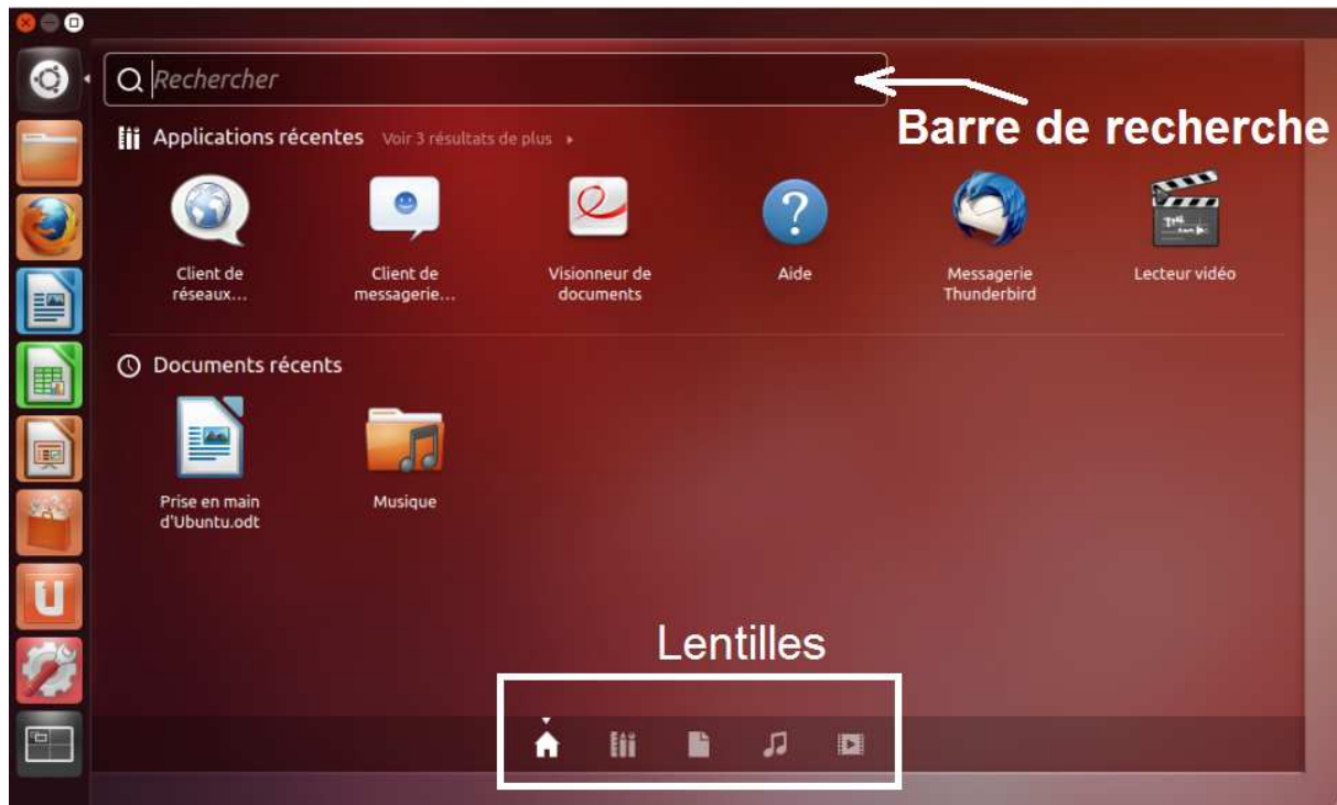
Figure 5 - Le tableau de bord en mode « Accueil »

Le tableau de bord se présente sous la forme d'une fenêtre relativement large surmontée de la barre de recherche . On y tape le nom d'une application ou d'un document pour faire apparaître sur le tableau de bord les icônes des éléments correspondants.