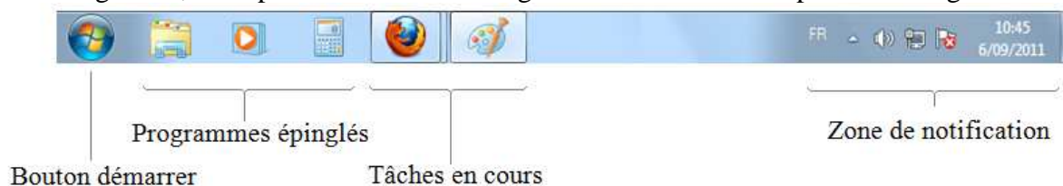
Barre des tâches pour Windows 7

Les concepteurs de Windows 7 ont considérablement amélioré cette barre des tâches. Les applications lancées y apparaissent sous la forme d'un bouton sans étiquette et, à moins que vous ne décidiez de modifier la configuration par défaut, les applications ouvertes plusieurs fois sont représentées par un seul bouton. Les boutons des tâches de Windows 7 peuvent y être réorganisés, il est possible de les faire glisser horizontalement pour en changer l'ordre.