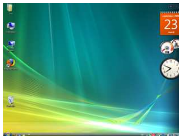
Bureau Windows Vista

L'aspect du bureau et du menu démarrer varient suivant la version de Windows mais cela dépend aussi de l'utilisateur qui ouvre la session. Nous verrons que chaque utilisateur autorisé