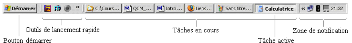
Barre des tâches pour Windows XP

La barre des tâches, située au bas de l'écran, montre quelles applications sont lancées. Elle permet de basculer de l'une à l'autre et montre quelle est la tâche active. Voici par exemple comment se présente la barre des tâches avec Windows XP.